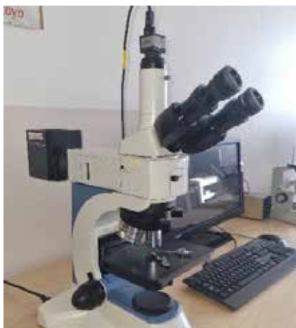
Laboratorium Inżynierii Materiałowej