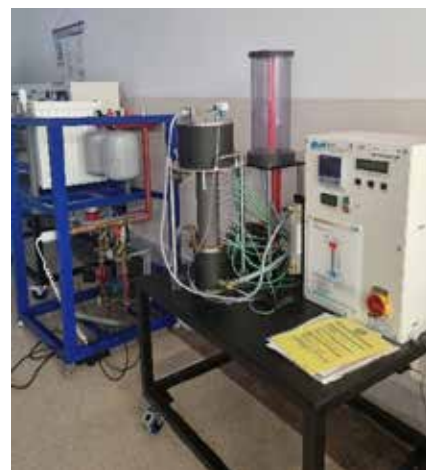
Laboratorium Fizyki, Termodynamiki i Mechaniki Płynów