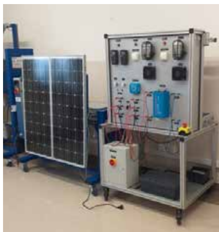
Laboratorium Odnawialnych Źródeł Energii