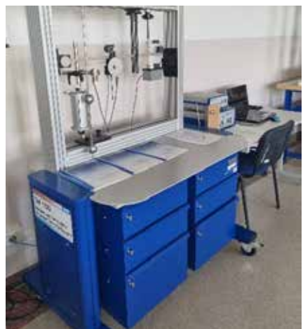
Laboratorium Mechaniki i Wytrzymałości Materiałów