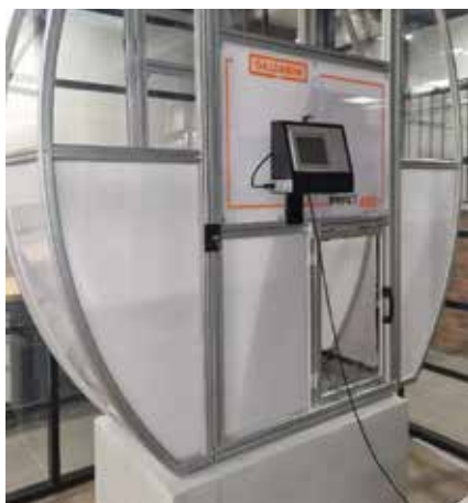
Pracownia Diagnostyki Materiałowej