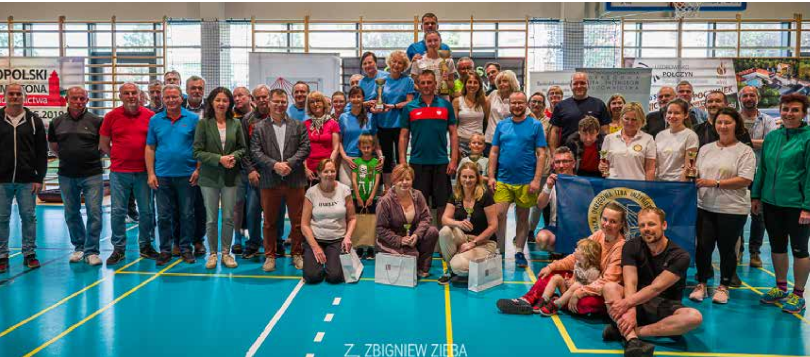
Z. ZBIGNIEW ZIĘBA PHOTOGRAPHY