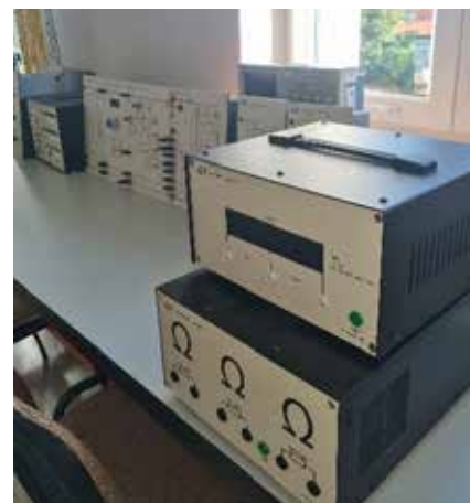
Laboratorium Podstaw Elektroniki i Elektrotechniki oraz Energetyki