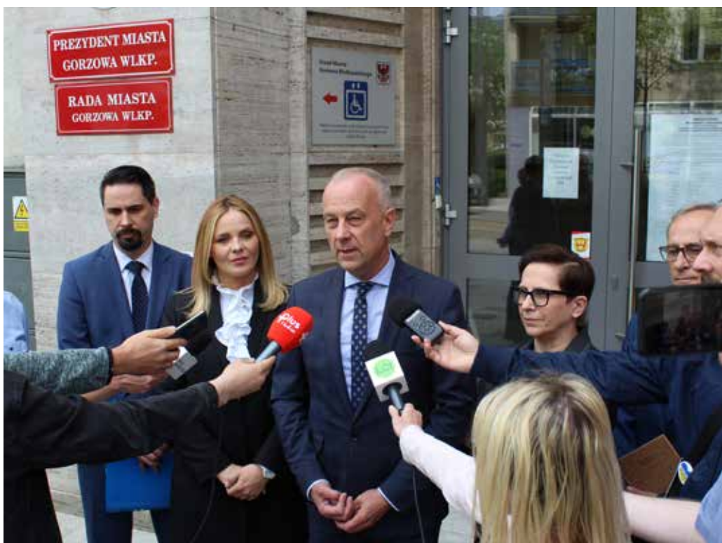
13 maja przed urzędem miasta w Gorzowie przedstawiciele urzędu marszałkowskiego oraz samorządu województwa mówili o statusie projektu północnej obwodnicy Gorzowa

Przypomniał, że już kilkanaście miesięcy temu budowa północnej obwodnicy Gorzowa zapisana została w strategii rozwoju województwa – to podstawowy dokument opisujący przedsięwzięcia ważne z punktu widzenia rozwoju regionalnego. Ta sama budowa jest wpisana do projektu kontraktu programowego – to z kolei podstawowy dokument regulujący sposób i celowość wydawania środków unijnych. Pozostała jeszcze kwestia wpisania północnej obwodnicy do koniecznego do przyjęcia – według wymogów Komisji Europejskiej – dokumentu plan rozwoju transportu. W tej sprawie prace jeszcze trwają – są realizowane przez zewnętrzną firmę wyłonioną w przetargu, zgodnie z określonymi procedurami unijnymi. Już przygotowany dokument trafi do konsultacji, potem będzie aprobowany przez zarząd województwa, a na końcu konsultowany z ministerstwem funduszy i Komisją Europejską.