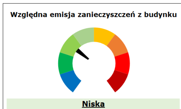
Rysunek 2. Sposób prezentacji oceny zintegrowanego wskaźnika względnej emisji na świadectwie charakterystyki energetycznym

Wynikiem końcowym prezentowanym na świadectwie charakterystyki energetycznej budynku jest ocena wskaźnika względnej emisji w formie graficznej wraz z przypisaną mu oceną ze skali zaprezentowanej na rysunku Rysunek 2.