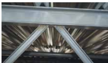
Rys. 4. Zastosowane pręty skratowania C40x20x5x5 w płatwi dachowej

Rysunek konstrukcji płatwi hali „G” zawierał również usterki. Pręty skratowania wykonane z kształtowników walcowanych o przekroju ceowym nie były usytuowane symetrycznie względem płaszczyzny kratownicy i nie podano pełnych wymiarów ceownika. Projektanci obiektu stwierdzili, że na niesymetryczne rozłożenie prętów skratowania płatwi nie mieli wpływu, nie uzasadniając dokładnie, co mają na myśli. Na rysunkach nie podano teoretycznych długości prętów. Nie było znane usytuowanie osi pręta skratowania w stosunku do osi pasa górnego czy dolnego kratownicy. Nie był znany sposób połączenia spoinami prętów kratownicy w węzłach. Wiązar kratowy zawierał podobne usterki jak w przypadku płatwi. W przekrojach hali „G” i hali „H” nie podano poziomów oparcia konstrukcji dachu, a wymiary poziomów są istotne z uwagi na prawidłowe wykonanie spadków dachu i wysokości obiektu.