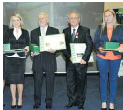
Lubuski Mister Budowy 2012, kategoria: drogi i mosty: Rozbudowa infrastruktury wodno-turystycznej w Bytomiu Odrzańskim