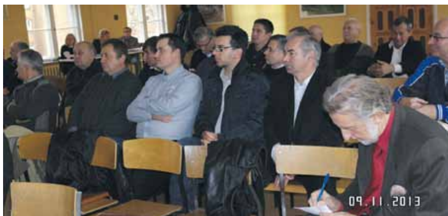
Listopadowe wybory delegatów LOIIB w Żarach

Oprócz wyboru władz delegaci dokonają m.in. wyboru delegatów na zjazd krajowy, jak również zdecydują o przyjęciu budżetu na rok 2014. Nie wszystkie z osób zgłoszonych na delegatów zostały wybrane. Wynikało to z przyjętej zasady wyborczej, mówią-