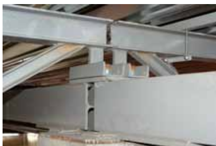
Rys. 5. Oparcie płatwi na dźwigarze głównym

do oparcia na trzech płatwiach i stanowiły dwuprzęsłową belkę o rozpiętości przęseł równą 6,00 m. Z tego względu płatwie, które znajdowały się w środku długości płyty, były znacznie bardziej obciążone od pozostałych. Należało ten fakt uwzględnić w obliczeniach nośności płatwi. Płyty fałdowe w miejscach oparcia były łączone z płatwiami w miejscach przylegania każdej fali, śrubami samogwintującymi (rys. 3), a poszczególne arkusze blachy były wzajemnie łączone jednostronnymi nitami rozstawionymi co około 50,0 cm.