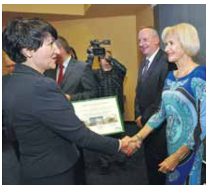
Lubuski Mister Budowy 2012, kategoria: zabytkowe obiekty budowlane: Budynek biurowo-usługowy przy ul. Bohaterów Westerplatte 32 (dawny Dom Kolejarza) w Zielonej Górze