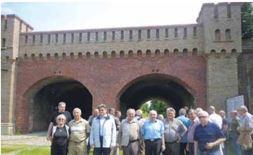
8 czerwca br. – uczestnicy wycieczki zorganizowanej przez LOIIB przed Bramą Berlińską