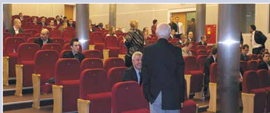
Listopadowy egzamin na uprawnienia budowlane w Wojewódzkiej i Miejskiej Bibliotece Publicznej w Gorzowie