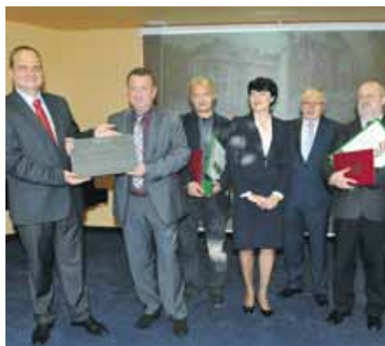
Lubuski Mister Budowy 2012, kategoria: budownictwo mieszkaniowe wielorodzinne: Rezydencja Villa Park – Gorzów