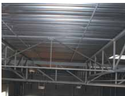
Rys. 6. Stężenia pionowe w hali „H” łączące pary płatwi. Tężniki pionowe, uzupełnione dodatkowymi prętami

Po zmierzeniu wymiarów prętów płatwi kratowej stwierdzono, że pręty skratowania nie są zgodne z projektowanymi. Na rysunkach konstrukcyjnych opisano pręty skratowania tylko symbolem litery U40. Zgodnie z oświadczeniem projektantów miały to być pręty o przekroju U40x35x6x5. Najprawdopodobniej, wykonawca konstrukcji odczytując oznaczenie na rysunkach konstrukcji uznał, że chodzi o kształtownik produkowany w hutach w Polsce, stosowany w naszym kraju powszechnie i znajdujący się w katalogach z oznaczeniem C (U) 40. Zastosowany kształtownik (C40x20x5x5) ma mniejsze wymiary w stosunku do przekroju przyjętego przez projektantów (rys. 4). Zastosowany kształtownik ma mniejsze pole przekroju poprzecznego, a smukłość większą. Wbu-