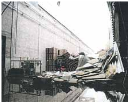
Rys. 1. Zawalony dach obiektu magazynowego

Zimą 2011 roku nastąpiło zawalenie jednej nawy hali „G” (rys.1). Halę magazynową „G” zaprojektowano w 2001 roku. Przewidziano dalszą rozbudowę obiektu i wykonano halę „H” – w planach rozbudowy miała być halą niższą. W rzeczywistości wykonano halę „H” wyższą od hali „G” (rys. 2). Zniszczeniu uległa nawa ozn. na rys. 2 jako nawa nr I, nawa nr II została częściowo uszkodzona. W miejscu różnicy wysokości budynków wystąpił efekt wiatru i odpowiednie przemieszczanie śniegu, powodujące zwiększenie obciążenia, w stosunku do projektowanego.