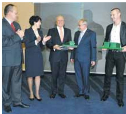
Lubuski Mister Budowy 2012, kategoria: adaptacje i remonty: Łądowisko dla śmigłowców LPR w Zielonej Górze