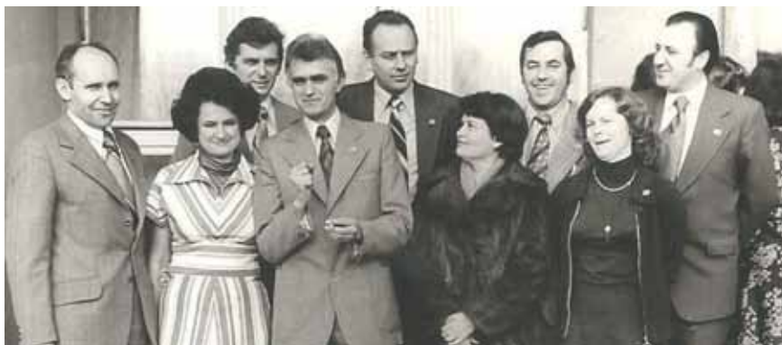
Zjazd absolwentów Technikum Budowlanego w Żarach