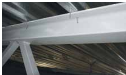
Rys. 3. Połączenie blachy fałdowej z pasem górnym płatwi kratowej

fałdowa nie zastąpi tężników, bez odpowiedniego mocowania tej blachy z konstrukcją, co również nie zostało podane.