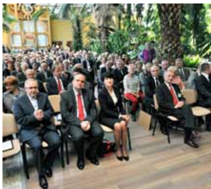
Gala Budownictwa 2013 w Palmiarni w Zielonej Górze