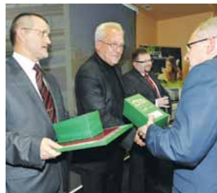
Lubuski Mister Budowy 2012, kategoria: budownictwo użyteczności publicznej: Biblioteka Uniwersytetu Zielonogórskiego