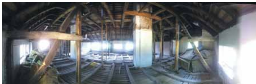
Tak działa aplikacja do tworzenia obrazów panoramicznych

Telefon komórkowy jest podstawowym narzędziem pracy. Wykonywanie połączeń jest obecnie jedną z wielu funkcji urządzenia przenośnego, które swą mocą obliczeniową dorównuje komputerom sprzed kilku lat. Zatem czy nazwanie go telefonem jest dalej właściwe?